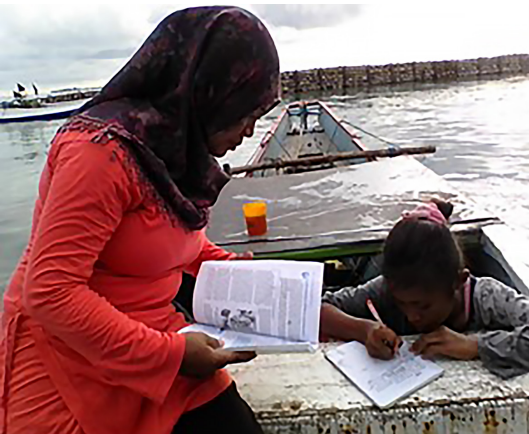
Siswi Kelas Perahu tengah tekun belajar.