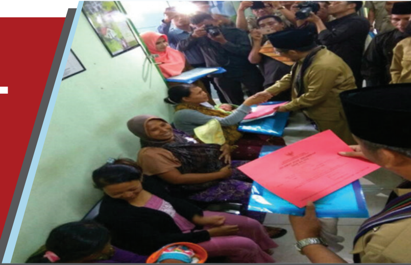
Pemberian akta kelahiran pada ibu yang baru melahirkan oleh bupati KLU di Puskesmas Kayangan pada saat Launching JARING PEKAT dan Kecamatan SIGAP

Model Percepatan Cakupan Kepemilikan Akta Kelahiran di Kabupaten Lombok Utara