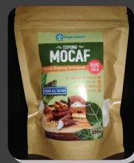
Logo/Merek dan Kemasan Baru